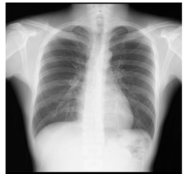
胸部 X 線検査